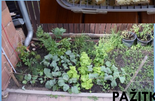
PAŽITKA KE SVAČINĚ