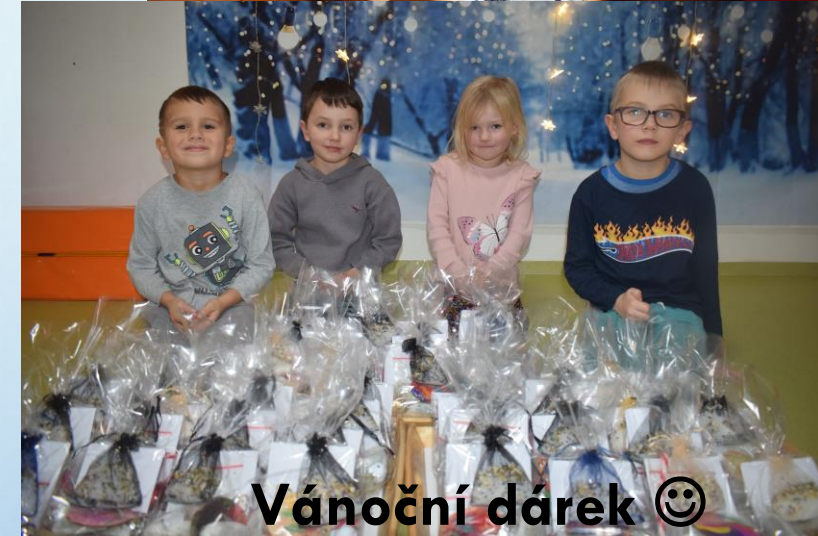
Vánoční dárek ☺